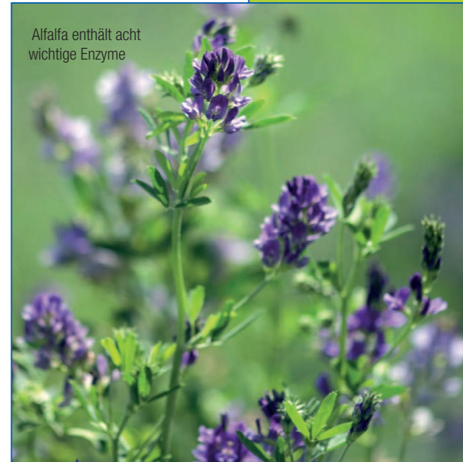
Alfalfa enthält acht wichtige Enzyme

Es kann das Wachstum von Pilzen blockieren, die Gesundheit im Mund-Rachen-Bereich verstärken, den Blutkreislauf verstärken, Körpergerüche verhindern, Heilungsprozesse positiv beeinflussen und vieles mehr.