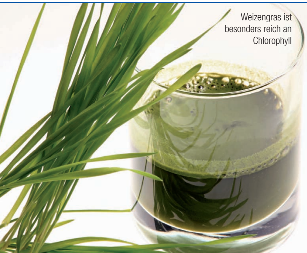
Weizen gras ist besonders reich an Chlorophyll